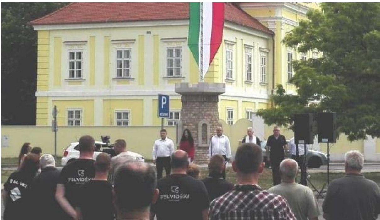
Obr. 2: Zhromaždenie v Dunajskej Strede dňa 4. júna 2022 pred pamätníkom so vztyčenou maďarskou vlajkou, odkiaľ štartoval aj „felvidécky“ motorkársky sprievod.

Pred pamätníkom sa uskutočňujú rôzne podujatia, smerujúce k odmietaniu Trianonskej mierovej zmluvy, alebo usporiadania štátov po druhej svetovej vojne, v duchu hesla: „Iba ten je naozajstný Maďar, koho bolí Trianon“.