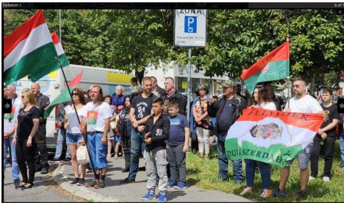
Obr. 3: Vlajky Maďarska a „Felvidéku“ (červeno-zelená) a vlajka s mapou tzv. veľkého Maďarska – na zhromaždení pred pamätníkom 3. júna 2023.