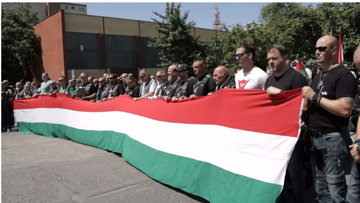
Obr. 6: Motorkárske protitrianonské podujatie pred pamätníkom v Dunajskej Strede, konané pri 105. výročí Uzatvorenia Trianonskej mierovej zmluvy, zdroj: https://ma7.sk/aktualis/eljen-a-magyar-szabadsag-eljen-a-haza-autos-motoros-felvonulas-trianon-105-evforduloja