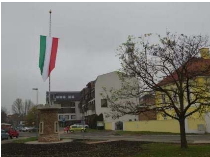
Obr. 1: Pamätník so vztyčenou maďarskou vlajkou v Dunajskej Strede na Múzejnej ulici blízko centra mesta v deň štátneho sviatku Maďarska

Architektonickým stvárnením stavba pamätníka vo forme baštovej veže s vlajkovou žrdou odkazuje na maďarské potrianonské hnutie, ktorého ideou je revízia Trianonu a obnovenie veľkého Maďarska.