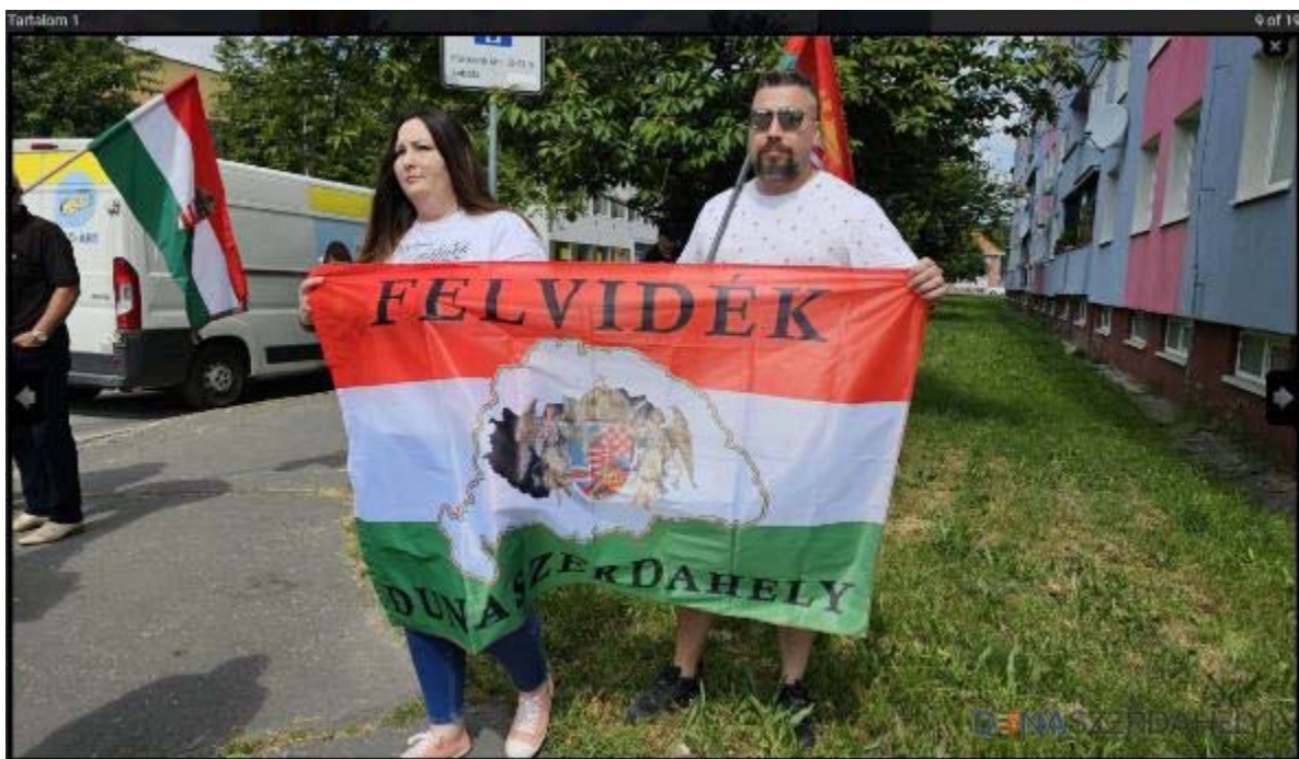
Obr. 4: Vlajka s názvom „Felvidék“ a mapou tzv. veľkého Maďarska a s názvom Dunajská Streda v maďarčine – na zhromaždení pri pamätníku.

Používanie názvu „Felvidék“ v preklade „Horná zem“ znamená návrat k pomenovaniu územia, do obdobia, kedy toto územie patrilo do tzv. veľkého Maďarska, čo bolo naposledy po Viedenskej arbitráži v rokoch 1938 – 1945, v období bezprávia a agresívneho maďarizačného útlaku Slovákov a iných nemaďarských národov.